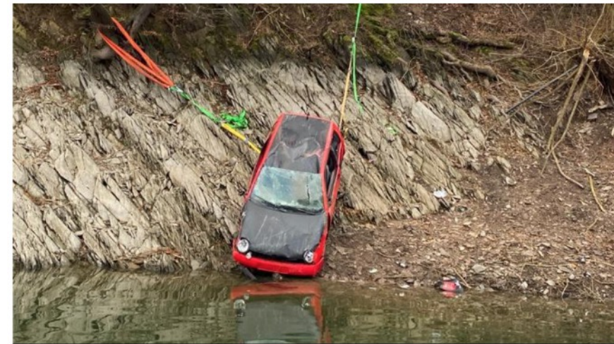
Der Fahrer des Wagens verstarb in seinem Auto, welches beim Eintreffen der Einsatzkräfte bereits vollständig unter Wasser war.