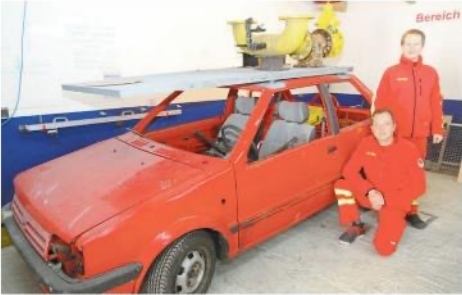
Bald soll das rote Auto auf dem Grund des Diemelsees liegen. Er dient dann den Rettungstauchern der DLRG Büren und auch Aktiven anderer Ortsgruppen im Hochstift als Ausbildungsort. Auch die Rettung von Menschen soll hier geübt werden.

BÜREN (ab). Die neue Freibadsaison hat gerade begonnen, und die Aktiven der Deutschen Lebensrettungs-Gesellschaft (DLRG) bereiten sich auf ihre Einsätze vor. So auch die Einsatztaucher. Ein unter optimalen Bedingungen über zu können und für alle Einsatzsituationen gerüstet zu sein, versetzen die jetzt sogar ein Auto ins Wasser.