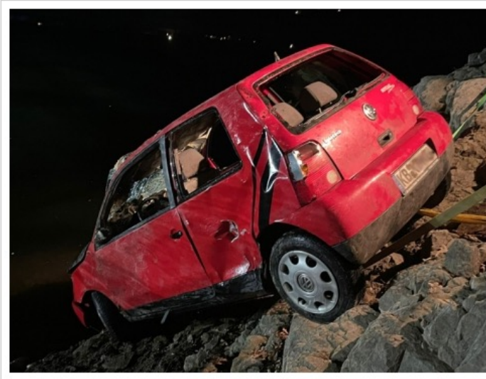
Ein VW Lupo ist am 12. Januar 2022 in den Diemelsee gestürzt - eine Person verstarb an der Unfallstelle.